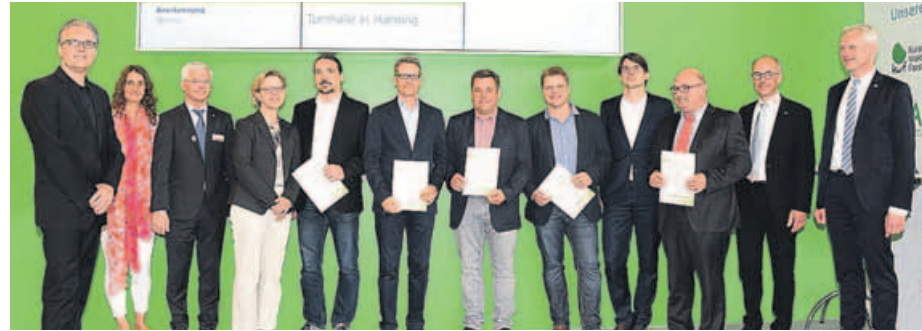
Juroren und Preisträger bei der Verleihung des Deutschen Holzbaupreises 2017 in Hannover.

In diesem Jahr wurden vier Projekte mit dem Deutschen Holzbaupreis ausgezeichnet: zwei herausragende Neubauten und zwei Arbeiten, die der Wettbewerbskategorie »Komponenten/Konzepte« zuzuordnen sind.