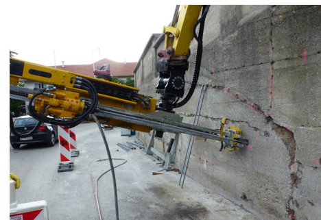
Gerät zur Herstellung von Mikropfählen