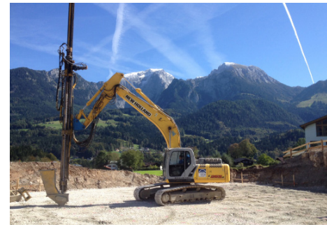
Gerät zur CSV-Bodenstabilisierung

Mikropfähle sind als Gründung zur Abtragung von Druck- und Zuglasten für unterschiedlichste Bauten geeignet. Ein weiterer Verwendungszweck ist auch der Einsatz als Auftriebssicherung oder Rückverankerung. Mikropfähle (auch Kleinbohrverpresspfähle) leiten Lasten über Mantelreibung ins Erdreich. Die innere Tragfähigkeit wird durch den Einbau eines Stahltraggliebes gewährleistet. Die Bohrlochstabilisierung erfolgt mittels einer Zementsuspension, die das Stahltragglied ummantelt. Mit diesem Verfahren wird die Tragfähigkeit des Baugrundes deutlich verbessert, da ein Mikropfahl Lasten von rd. 1000 kN weiterleiten kann. Die Mikropfähle können bei beengten Platzverhältnissen mit Bagger und Bohrlafette hergestellt werden. Somit ist dieses Verfahren oft eine ideale Lösung, wenn im Rahmen einer Bausanierung im Bestand gegründet oder nachgegründet werden muss.