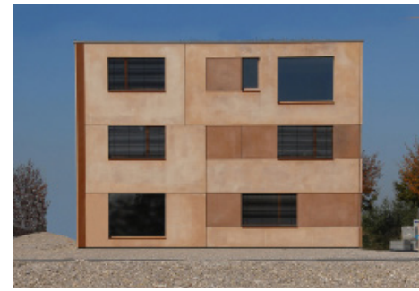
Bürogebäude aus Farbbeton

Sich auf das Wesentliche konzentrieren und bei nur einem Ansprechpartner die eigenen Vorstellungen optimal einbringen können – das sind beim Schlüsselfertigen Bauen die wichtigsten Vorteile für den Bauherrn. Die breite Produktpalette der verschiedenen Abteilungen der Firmengruppe und das hauseigene Konstruktionsbüro der Firma halten den „direkten Draht“ noch kürzer. Das beschleunigt den Informationsfluss und bietet die Möglichkeit, auf planerische Änderungswünsche schnell reagieren zu können. Ohne problematische Schnittstellen zwischen den einzelnen Gewerken können Bauvorhaben wie aus einem Guss realisiert werden. Als eigenständiger Bereich innerhalb der Firmengruppe verfügt die LAUMER KOMPLETTBAU GMBH dabei über die Unabhängigkeit, die man braucht, um die bestmögliche Umsetzung eines Projekts durch die objektive Wahl der Bauweise und der verwendeten Materialien zu gewährleisten.